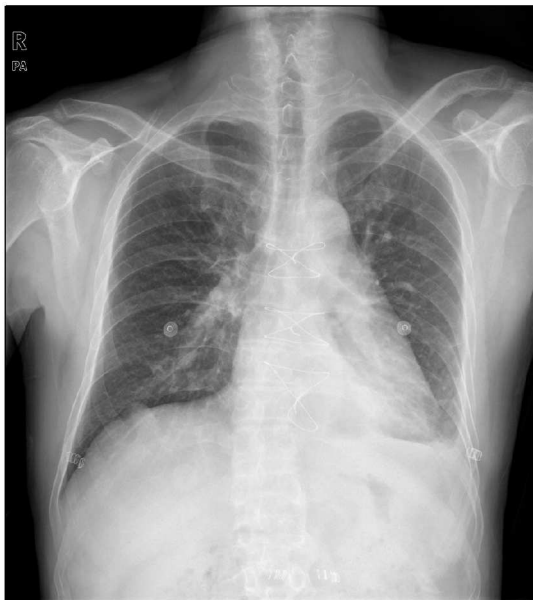
Fig. 2. Chest PA showing mild cardiomegaly.

상성 삼첨판막 폐쇄부전으로 진단을 하고 수술을 하였다. 수술은 전신마취 하에 전통적인 정중 흉골 절개술을 시행하였다. 흉골과 심막의 유착, 심막과 심장과의 유착을 박리 후 통상적인 심폐우회를 하였으며 직장 체온은 28°C까지 내렸다. 심장정지 상태에서 우심방을 열고 삼첨판막을 관찰하였다. 중격판막의 접합면(commisure)에 붙어 있는 건삭 중 일부가 유두 근으로부터 분리되어 있었다(Fig. 3). 건삭의 길이를 측정하여 5-0 PTFE 봉합사를 이용하여 새로운 건삭을 2개 조성하고 36 mm Edward 판막링을 이용